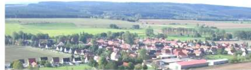
Tonndorf; Blick vom Turm

Vorwiegend Einzelbetreuung und in Ausnahmefällen Kleinstgruppenbetreuung möglich (2 bis max. 4 Pers.)