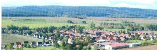
Tonndorf; Blick vom Turm

Vorwiegend Einzelbetreuung und in Ausnahmefällen Kleinstgruppenbetreuung möglich (2 bis max. 4 Pers.)